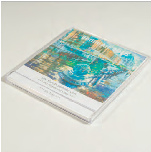
Abbildungen: Berlin Art 2016