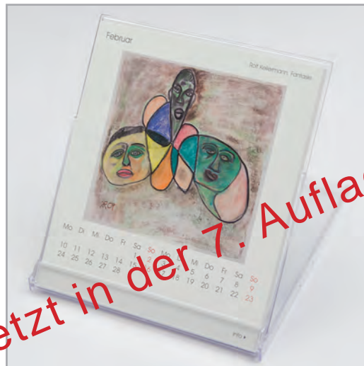
Abbildung: Berlin Art 2015

... und sich ein ganzes Jahr, Monat für Monat freuen.